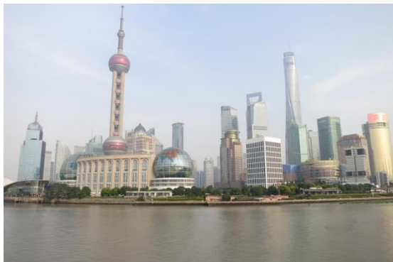
Shanghai verzeichnete 2014 das höchste Pro-Kopf-Einkommen Chinas. Aufgrund zunehmender Restriktionen lebten 2015 erstmals weniger Migranten in der Stadt als im Jahr zuvor.

generiert: 2006 lag das Bruttoinlandsprodukt pro Kopf im Osten bei 153 Prozent des nationalen Durchschnitts, während es im Rest des Landes nur 70 Prozent betrug. 8 Hergestellt wurden die Güter meist von Arbeitsmigranten aus den armen Regionen West- und Zentralchinas, die Anfang des Jahrtausends 68 Prozent aller Stellen im verarbeitenden Gewerbe besetzten. 9 Die Zahl der in China sogenannten „fließenden“ Bevölkerung, also der Personen, deren Arbeitsort von den Angaben im Hukou abweicht, nahm nach der Jahrtausendwende weiter stetig zu. 2005 wurden 147 Millionen, 2010 dann bereits 221 Millionen gezählt. 10 Der Osten des Landes ist dabei bis heute das bevorzugte Ziel der Arbeitsmigration geblieben, während Provinzen im Süden und Südwesten seit vielen Jahren eine zum Teil massive Abwanderung ihrer Landbevölkerung erleben.