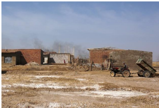
Ein Dorf in der Provinz Gansu in Westchina. Die Provinz ist eine der ärmsten des Landes.

Ebenfalls ab Anfang der 1980er wurde damit begonnen, Sonderwirtschaftszonen einzurichten, in denen ausländischen Investoren die Produktion von Gütern für den Weltmarkt ermöglicht wurde. Diese erwiesen sich schnell als äußerst erfolgreich und wurden zur Keimzelle der Entwicklung, die China im Laufe der nächsten 30 Jahre zum Exportweltmeister aufsteigen ließ. Die Einbindung in globale Wertschöpfungsketten wurde – neben der Schwerindustrie und dem Baugewerbe – zum Motor der rasanten Wirtschaftsentwicklung, die dem Land über drei Jahrzehnte hinweg durchschnittliche Wachstumsraten von annähernd zehn Prozent jährlich bescherte.